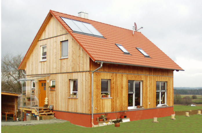
Ein HOLZBAUHAUS in Gottsfeld!